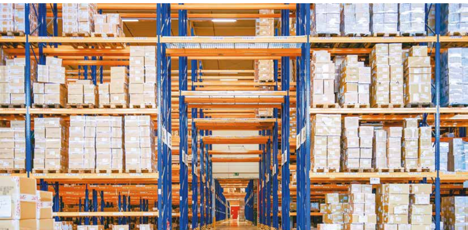
Photo non-contractuelle, donnée à titre d'illustration Actif ne figurant pas dans le patrimoine de la SCPI ACTIVIMMO et n'ayant pas vocation à l'être

ACTIVIMMO n'a pas comptabilisé de revenus financiers, aucune déclaration n'est donc nécessaire à ce titre. Les associés soumis à l'IFI (impôt sur la fortune immobilière) peuvent retenir la valeur de 545,34 € par part au 31 décembre 2019. Enfin, les associés soumis à l'impôt sur les sociétés déclarent un revenu de 3,15 € par part en jouissance.